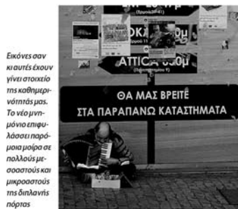
Εικόνες σαν κι αυτές έχουν γίνει στοιχείο της καθημερινότητάς μας. Το νέο μνημόνιο επιμύλλασει παράμοια μοίρα σε πολλούς μεσοασούς και μικροασούς της διπλανής πόρτας

ΠΩΣ ΕΓΙΝΑΝ ΝΕΟΠΤΩΧΟΙ ΜΙΑ ΑΝΕΡΓΗ, ΕΝΑΣ ΑΓΡΟΤΗΣ ΚΑΙ ΜΙΑ ΕΦΕΔΡΗ ΔΗΜΟΣΙΑ ΥΠΑΛΛΗΛΟΣ